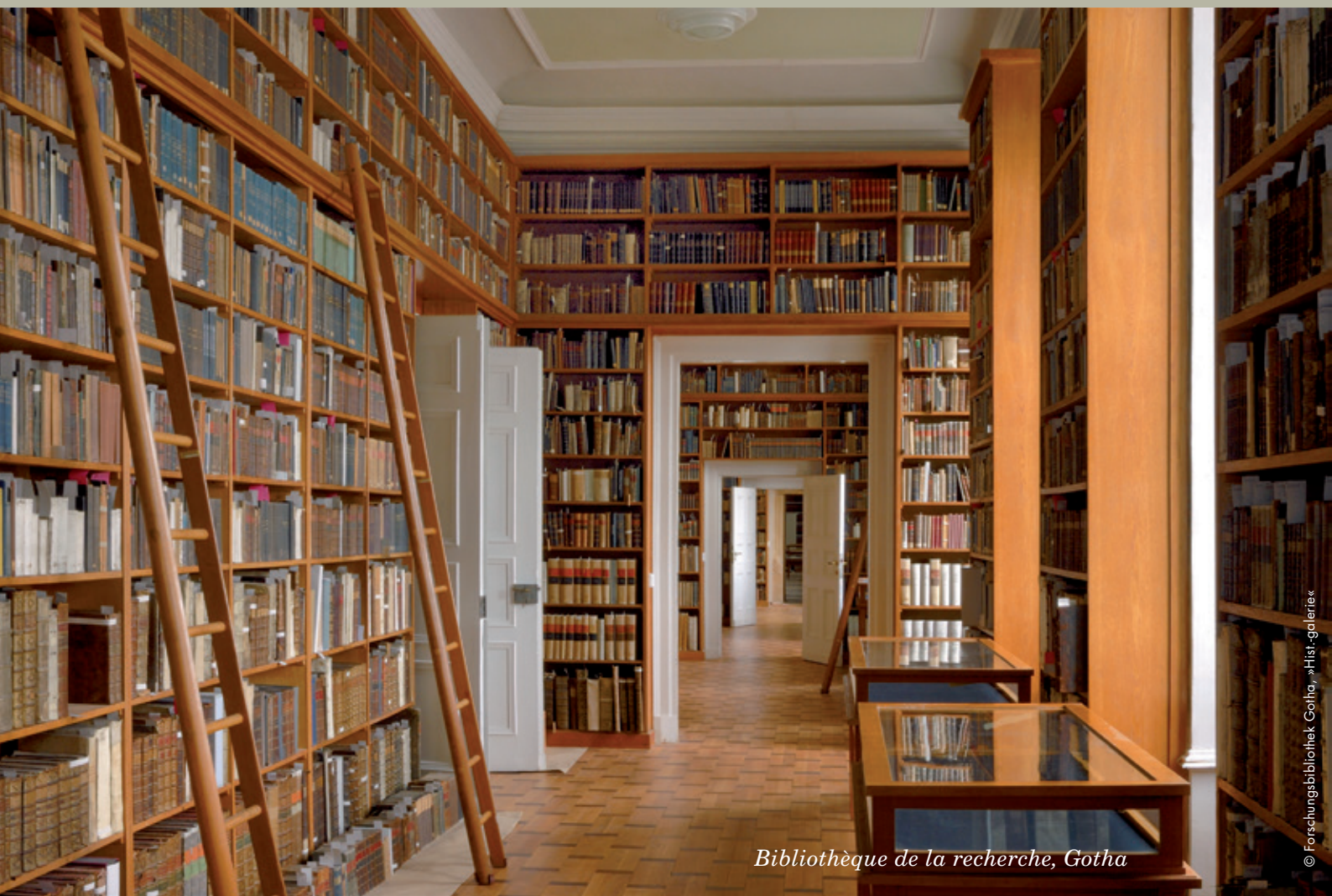
Bibliothèque de la recherche, Gotha

Histoire de l'imprimerie, du livre et de l'écriture